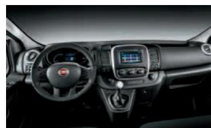
Kod unutrašnjosti 009 (Opc. 8L0)